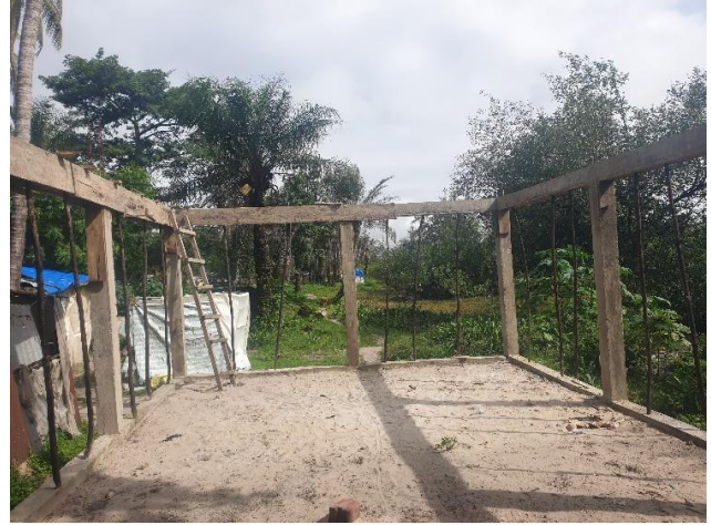
Construction de 6 latrines -3 bâtiments de deux compartiments et d'un fumoir

En outre, ce projet, en cours d'atteinte, a pu produire des résultats tangibles, notamment en termes de plaidoyer, d'engagement et de mobilisation des parties prenantes pour soutenir la cause des communautés tayaki. Ainsi à cet égard :