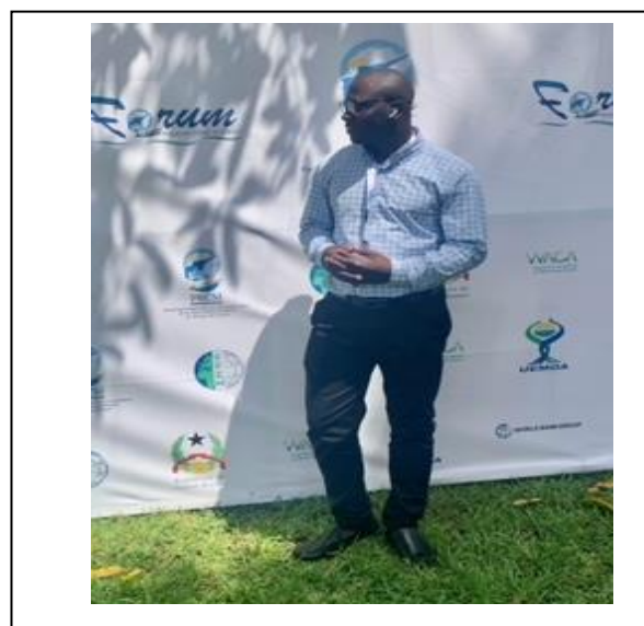
Présence de GT2050 au forum Régional Marin

En somme, la participation de GT2050 à ce forum a permis non seulement de promouvoir ses actions, mais également d'élargir ses perspectives de partenariat dans le domaine de la conservation marine et côtière.