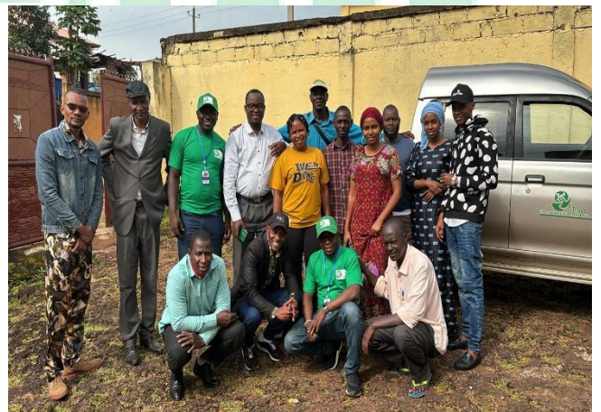
Formation des superviseurs dans le cadre de la sensibilisation des acteurs pour l'intégration du changement climatique