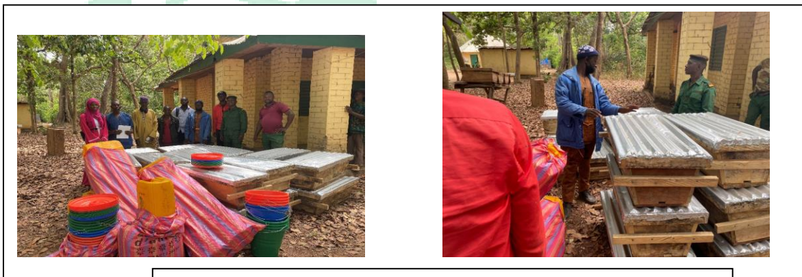
Remise des équipements apicoles aux GIEs

Deux groupements d'intérêts économiques dans le parc ont été accompagnés avec des équipements de travail dans le secteur de l'apiculture, dont 20 ruches kenyanes, des canettes de 10 litres et 10 seaux pour augmenter la production de produits forestiers non ligneux (miel et beurre de karité).