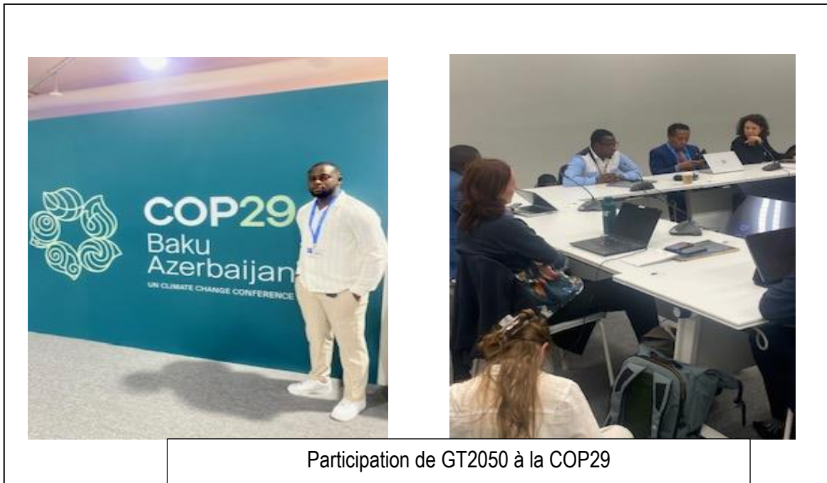
Participation de GT2050 à la COP29