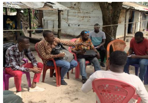
Consultation avec les communautés locales de Kabback et Tayaki