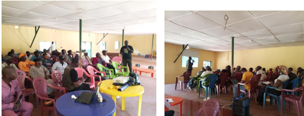
Cadre de concertation avec les populations locale de KASSA, Fotoba, et Rome ainsi que l'unité de conservation et les services déconcentrés.