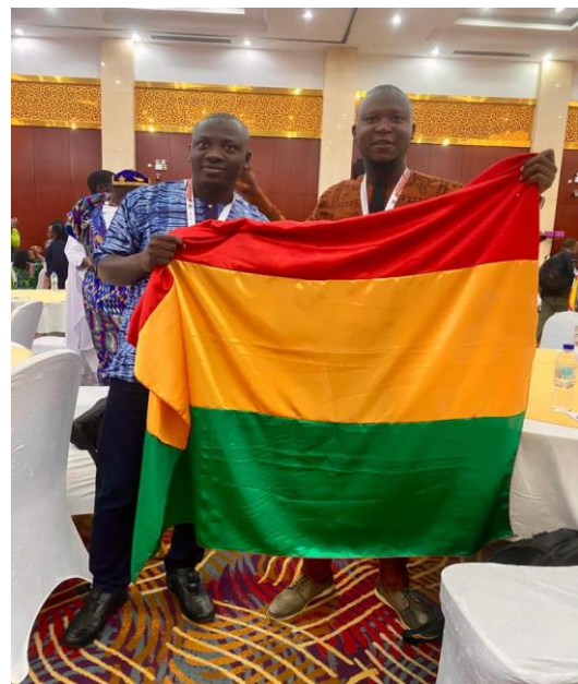
Les agents de GT2050 au Sommet sur l'agroécologie en Ethiopie