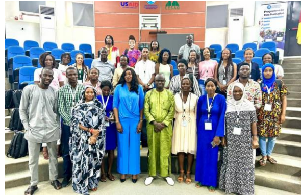
Présence de L'Assistant financier de GT2050 au programme YALI