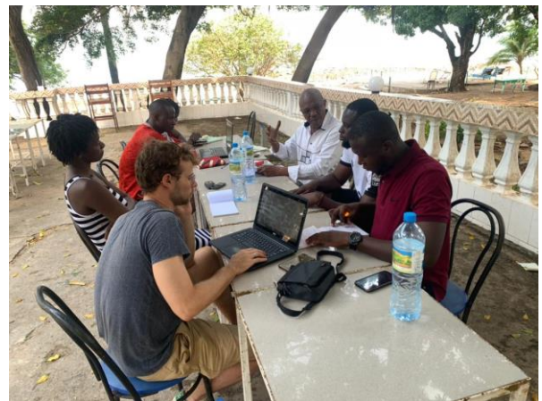
Diagnostic organisationnelle de GT2050